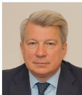
Вице-губернатор по жилищно-коммунальному хозяйству и топливно-энергетическому комплексу Ленинградской области