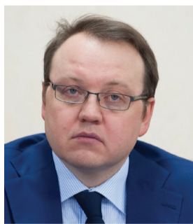
Председатель комитета по ЖКХ и транспорту Ленинградской области

Поздравляю Вас с профессиональным праздником! Желаю благополучия и успехов в Вашем нелегком труде!»