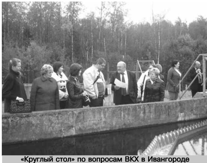
«Круглый стол» по вопросам ВКХ в Ивангороде

Ввиду того, что канализационные сети города к тому времени уже были изношены, наполовину очищенные стоки сбрасывались прямо в Нарву, а, следовательно, и в Балтийское море, Европа забила тревогу. В срочном порядке Правительство Ленобласти, датское агентство по за-