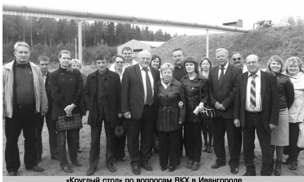
«Круглый стол» по вопросам ВКХ в Ивангороде

В целом мероприятие прошло достаточно результативно: удалось пообщаться и услышать друг друга. Один из важных аспектов взаимодействия водоканалов и администраций – это умение слышать друг друга, особенно в таких непростых условиях выживания отрасли ВКХ, которые существуют сегодня. Поэтому необходимо объединить усилия, чтобы сделать взаимную работу наиболее легкой, приятной, и главное качественной.